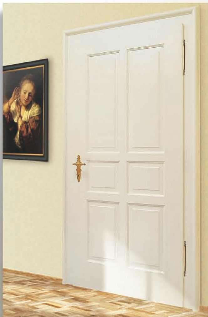
Türe St. Magdalena

Eine Ausnahmestellung in Design und Verarbeitung nimmt diese Türe ein.